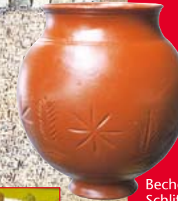
Becher mit Schliffdekor (Terra Sigillata).