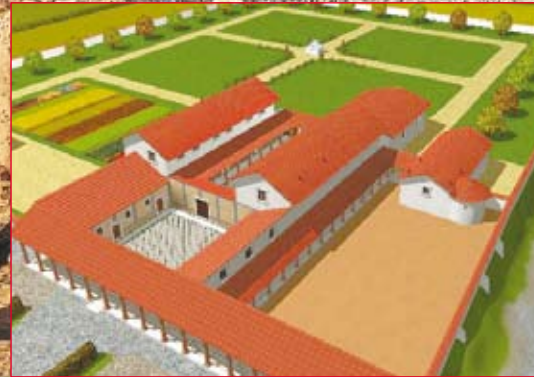
Rekonstruktion des Hauptgebäudes.

Gesamtplan der Villa urbana. Rot = Hauptgebäude und Garten. Grün = Wirtschaftsteil