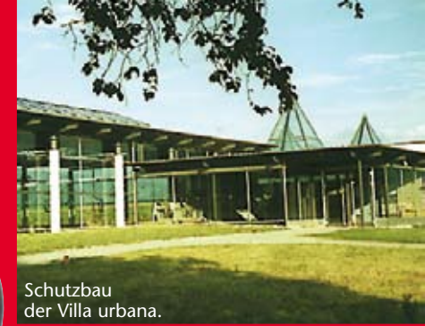
Schutzbau der Villa urbana.