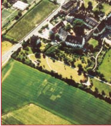
Das Luftbild zeigt die Mauerzüge der Villa urbana hinter dem Malteserschloss.

Ein römischer Großgrundbesitzer ließ sich im 1. Jh. n. Chr. eine Villa in mediterranem Stil erbauen. Das beheizbare Wohngebäude besaß einen Innenhof mit einem 18 m langen Zierwasserbecken und war von einem Garten umgeben. Bemalter Wandverputz, Mosaiken und Marmorverkleidungen zeugen von der prächtigen Ausstattung des Repräsentationsbaus. Die Anlage bestand bis etwa 275 n. Chr.