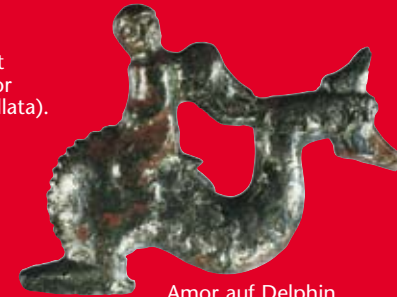
Amor auf Delphin reitend, Gewandspange aus Silber.

Der Kernbereich des Wohnhauses ist mit einem modernen Schutzbau überdacht. Hier sind das Wasserbecken und ein Vorratskeller an ihrem Originalstandort zu besichtigen.