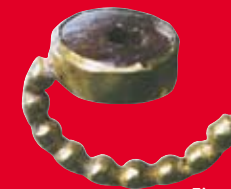
Fingerring aus Gold mit eingelegtem Bernstein.

Der Kernbereich des Wohnhauses ist mit einem modernen Schutzbau überdacht. Hier sind das Wasserbecken und ein Vorratskeller an ihrem Originalstandort zu besichtigen.