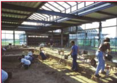
Ausgrabungen im Schutzbau.

Ein römischer Großgrundbesitzer ließ sich im 1. Jh. n. Chr. eine Villa in mediterranem Stil erbauen. Das beheizbare Wohngebäude besaß einen Innenhof mit einem 18 m langen Zierwasserbecken und war von einem Garten umgeben. Bemalter Wandverputz, Mosaiken und Marmorverkleidungen zeugen von der prächtigen Ausstattung des Repräsentationsbaus. Die Anlage bestand bis etwa 275 n. Chr.